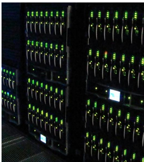
Servidores da Locaweb

A Locaweb tem a missão de viabilizar o sucesso de seus clientes por meio de serviços inovadores de internet. A companhia acredita que a inovação tecnológica aliada à qualidade de serviços e uma equipe altamente qualificada são as chaves para o sucesso no mercado.