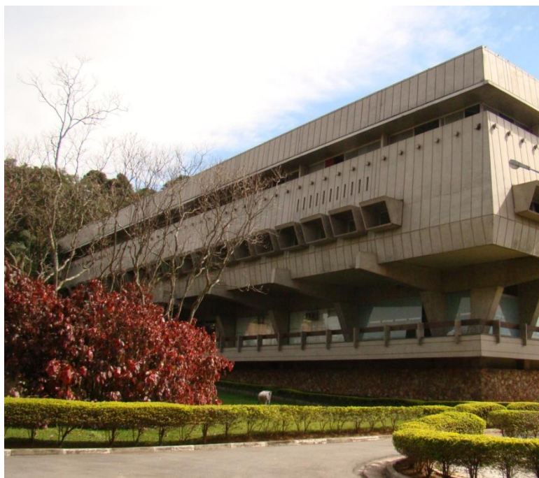
Sede & Data Center Itapaiúna